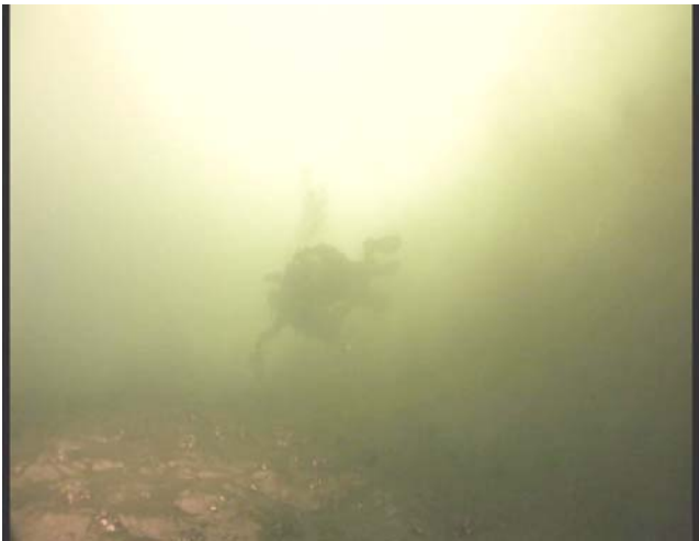
The Bell, Audrius Stonys

El tiempo es el elemento que determina más sus películas. Podemos incluso decir que todas las imágenes tienden a descubrir el secreto del tiempo y el método para filmarlo.