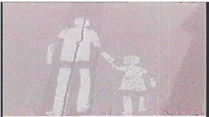
_, Seppo Renvall