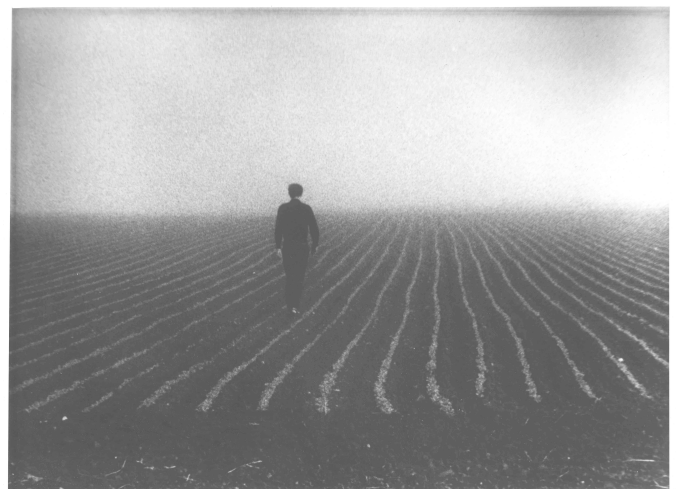
Hägringen, Peter Weiss

Peter Weiss (1918-1982) va deixar de ser un autor de culte molt aviat després de la seva mort. Ara mateix és una figura ben just recordada per unes poques obres de teatre. La famosa obra sobre la Revolució Francesa, Marat/Sade (1965), i una macronovel·la titulada La estètica de la resistència (1975-1979) el situen al bell mig de la literatura europea de la postguerra. Però el