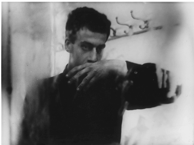
Hägringen, Peter Weiss