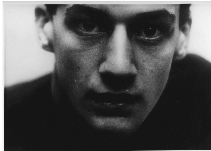
Hägringen, Peter Weiss