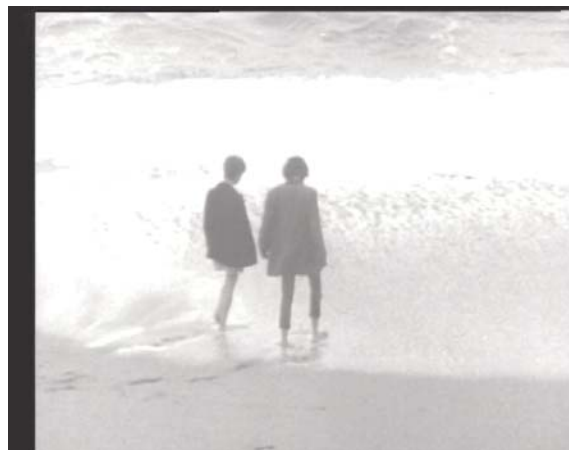
Souvenir , VVAA