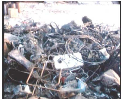
En la ciudad, VVAA