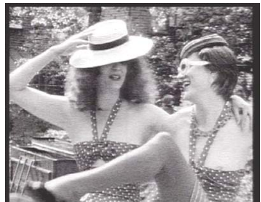
Glitterbug, Derek Jarman