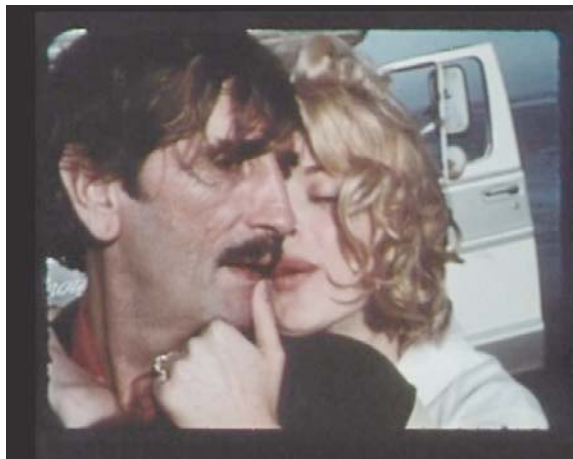
Souvenir , VVAA

Glitterbug , Derek Jarman. 1994, 53 min.