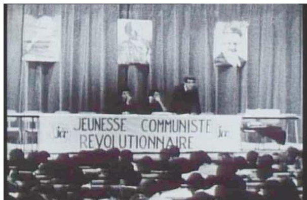
Mourir à trente ans , Roman Goupil

És un film estrany. És impressionant la llista de totes les coses que no és. En desordre: ni una evocació nostàlgica de la joventut militant, fanfarrona i seriosa al mateix temps. Ni una amarga meditació sobre el temps que passa, les creences que es trenquen, les complicitats que s'abandonen. Ni un balanç sobre l'època, la Lliga i la seva línia. Cap culpa política batuda, cap hagiografia de l'amic desaparegut. I, sobretot (i és aquí on el film és estrany), cap interrogació sobre Recanati, cap desig de saber més, res a elucidar, cap «personatge» a reconstituir, res. És en aquest punt on el film de Goupil és a les antípodes de l'essència novel·lesca. Allò novel·lesc (per entendre'ns, una novel·la de James o un film d'Oliveira) hauria consistit a dir: està mort i jo no en sabia res, d'ell, tot resta per elucidar i mai hi posarem la paraula «fi». Mentre que, a Mourir à trente ans , Recanati també està mort per a l'espectador. Per traçar la línia que separa a partir d'ara la seva mort, Goupil fa (una mica ràpid, al meu parer) una explicació psicològica, avui fàcil, del cas Recanati: patologia del revolucionari professional, desert afectiu del militant d'organització, mort a la vida. Comprenem llavors que Goupil se separa d'alguna cosa: no dels amics, sinó del llast que hi havia entre ells i que, en un moment donat, va bascular d'un únic cantó. Hi ha un sord vae victis en aquest film. Sord i impersonal.