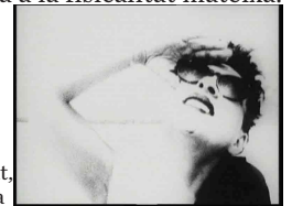
Danke, es hat mich sehr gefreut. Mara Mattuschka

I el nostre vell Emperador digué: "Gràcies, ha estat molt agradable, fou un plaer!" (M.M.) Quasi totes les seves pel·lícules tracten de l'escriptura i el llenguatge, que en el cas de Mattuschka, significa atacar els sistemes simbòlics del llenguatge. Això es fa sovint de manera críptica, o com a mínim no necessàriament tan obvia com la manera en la qual Mattuschka acostuma a implicar el cos humà, és a dir, el seu propi cos en el personatge de Mimi Minus, la sensualitat del qual és la màxima expressió de l'antítesi cap a la naturalesa abstracta del llenguatge. A les seves pel·lícules, són pocs els plans que no l'inclouen, i en aquests, les imatges solen fer referència a la fisicalitat mateixa.