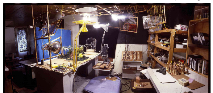
Monster Road, Brett Ingram