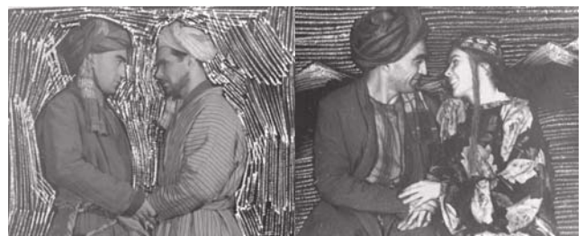
Dokhunda, Lev Kuleshov