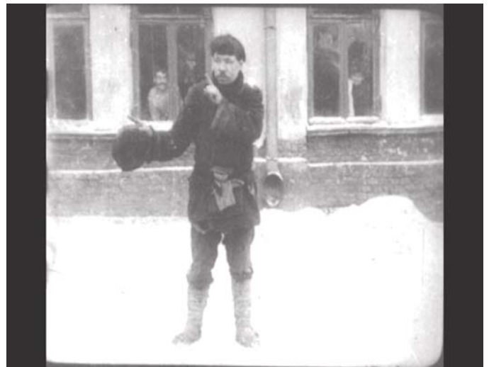
Alcoholism and Its Ill-effects, Khanzhonkov Studios