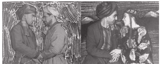
Dokhunda, Lev Kuleshov