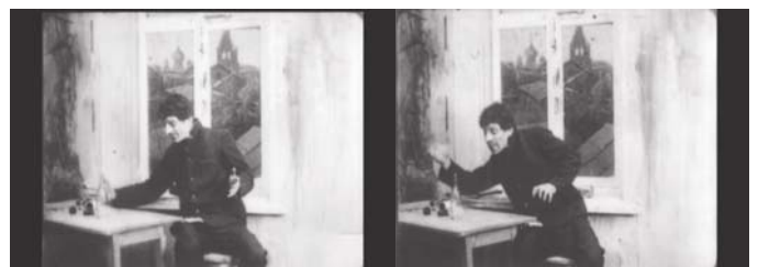
Alcoholism and Its Ill-effects, Khanzhonkov Studios